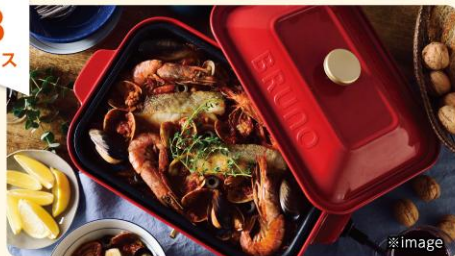
BRUNO コンパクトホットプレート鍋セット (赤)