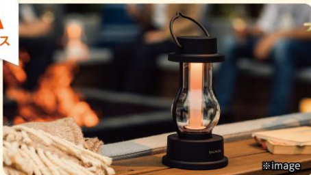
BALMUDA The Lantern (黒)