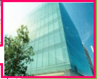
ホンダ開発(株) 本社ビル