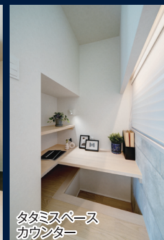
タタミスペース カウンター