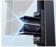
Σ形デバイス 断面図

エネルギー吸収型耐力壁「D-NΣQST(ディーネクスト)」が耐震性能を持続させる鍵は、「Σ形デバイス」にあります。強い揺れをうけると上へ下へとしなやかに動く独自の断面形状により、地震エネルギーを効果的に吸収。震度7クラスの地震に連続して耐える粘り強さを発揮します。さらに、地震による揺れ幅を軽減し建物の揺れを早く収束させることで、外壁や構造体の損傷を最小限に抑えます。