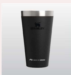
ステンスタンブラー STANLEY