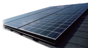
太陽光発電システム