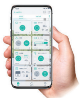
スマートIoTシステム (HEMS機能付)