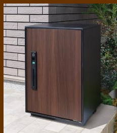
COMBO-LIGHT W390×D473×H590 重さ8.0kg