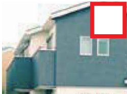
外壁メンテナンスを 10年以上していない