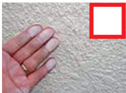
手で触ると 白い粉がつく