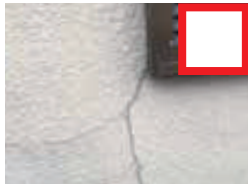
外壁に ひび割れがある