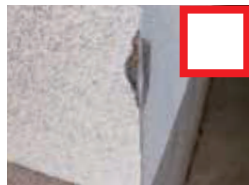
外壁が 剥がれている