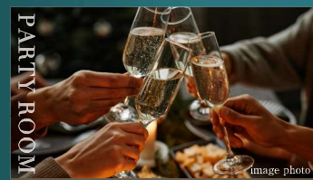
パーティールーム