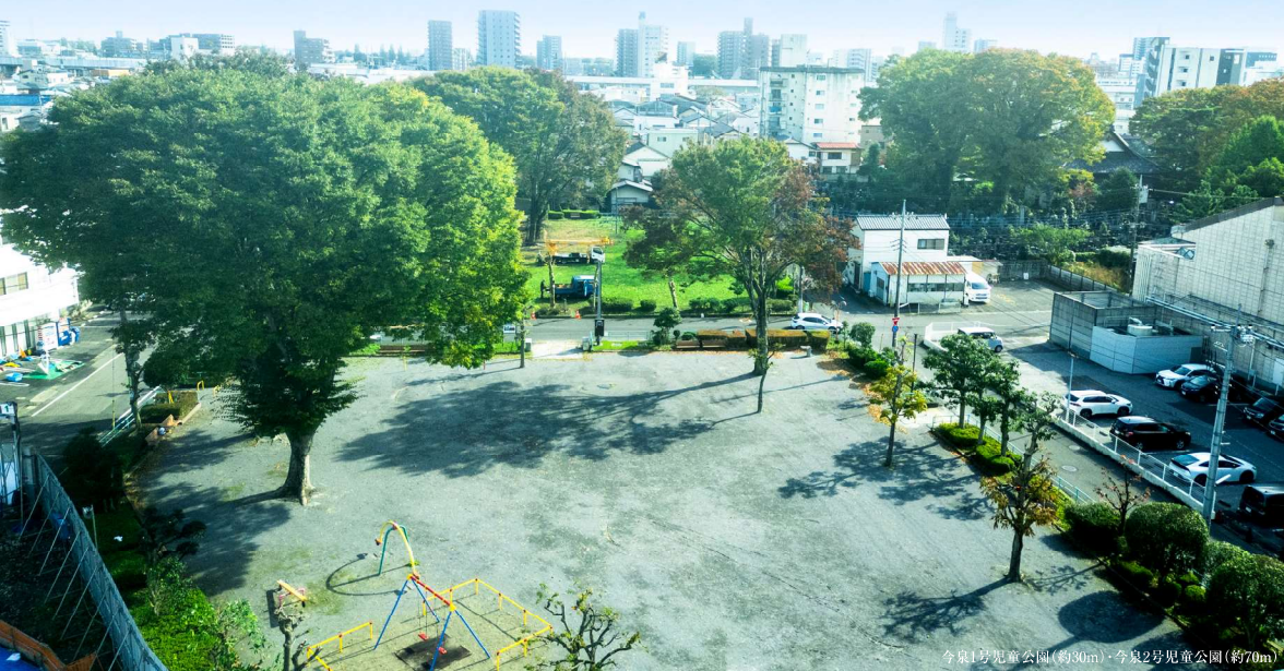
今泉1号児童公園(約30m)・今泉2号児童公園(約70m)